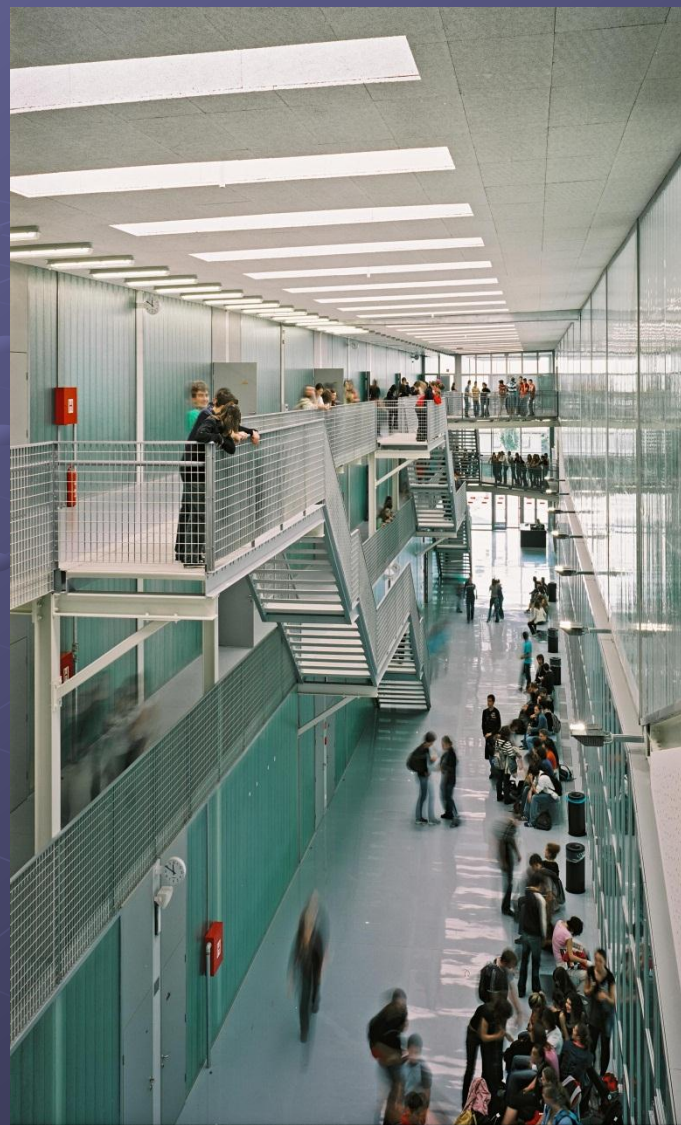
V. Robotić: GFG KC-JPP, Koprivnica, 2016.