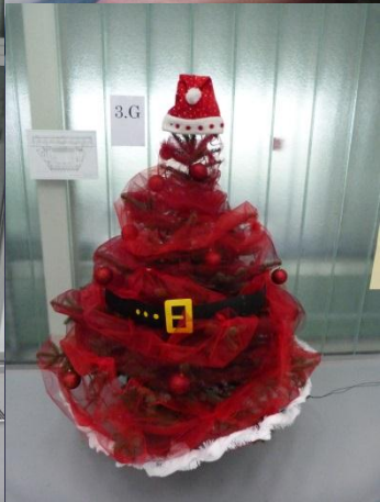
V. Robotić: GFG KC-JPP, Koprivnica, 2015.