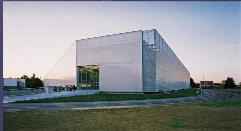
V. Robotić: GFG KC-JPP, Koprivnica, 2016.