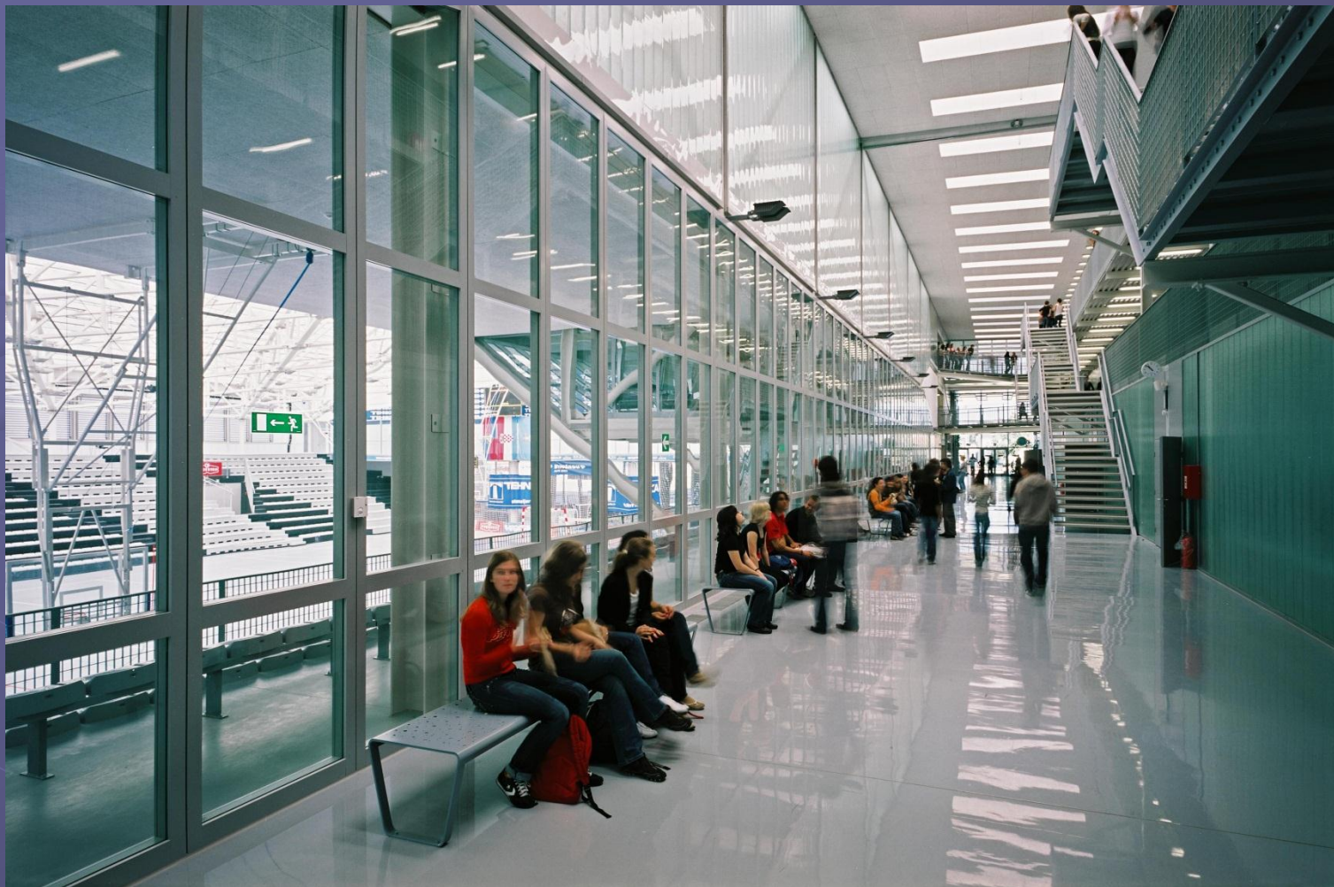
V. Robotić: GFG KC-JPP, Koprivnica, 2016.